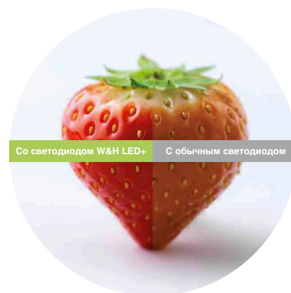
Сравнение светодиодов: естественная передача оттенков красного цвета при освещении светодиодом W&H LED+

красные тона спектра – это весьма существенный недостаток, с которым сталкиваются врачи во время медицинских применений. Однако в угловых наконечниках Alegria LED+ используется новая технология. В результате величина CRI превышает значение 90, что повышает четкость цветовых контрастов и обеспечивает исключительное воспроизведение естественных красных оттенков при работе в полости рта.